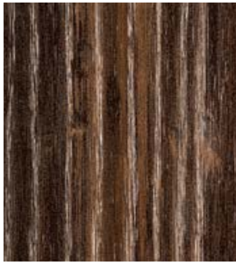
Дуб каньон чёрный