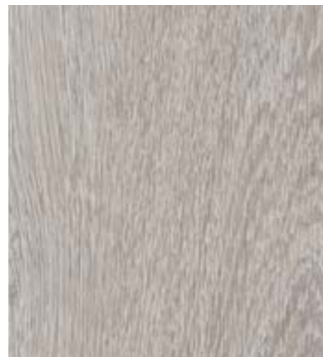
Дуб эверест светлый