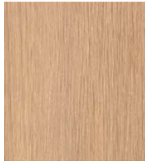
Дуб алжирский кремовый