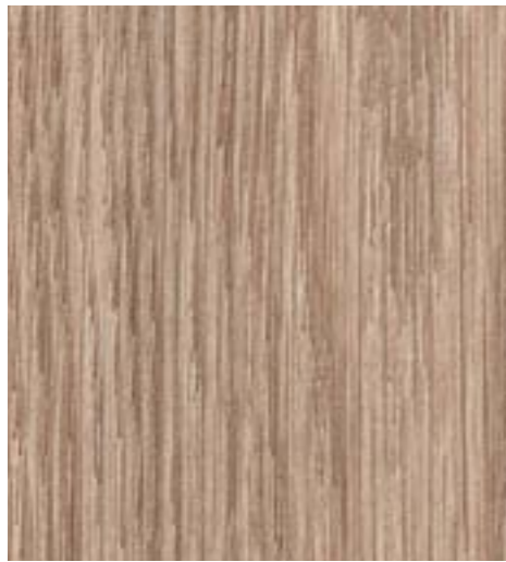
Дуб палермо классический